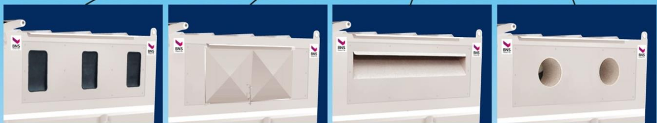
Flexi sidemodul Gummiklaff