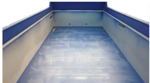
6 stk. leddet surrefester montert innvendig for transport av 8T gravere